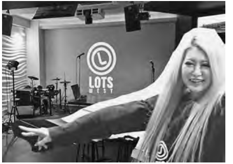
▶ロックスエストで新感覚の夜を楽しもう

ロックスエストではバンド演奏やポールダンスショーなども同時行っているのですが、毎回違った楽しみ方ができるのも大きなセールスポイントだ。