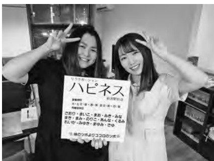
▶リラクゼーションハピネス新潟駅前店の女性スタッフ

「体のツボより心のツボ」をキャッチコピーとする同店は創業9年目。県内のリラクゼーション業界では老舗的な