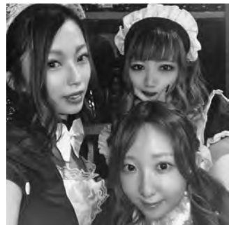
▶シシュの女の子たちは20代前半

一角にある隠れ家的なお店。スタッフの平均年齢層は20代前半で、実に礼儀正しい子ばかりだ。少人数や1人でも安