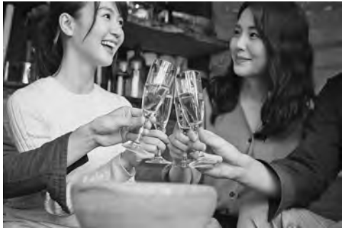
▶「今すぐ乾杯」で見つける新しい出会い

スマホやPC（パソコン）を通じて女の子とコンタクトを取り、居酒屋やバーなどアナタが飲んでいるお店に彼女