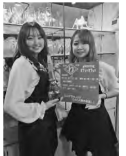
▶レトロ広場わいわいの女性スタッフ

にはうってつけのお店だが、フード類も充実しているのでお腹が空いている人も大丈夫。いつでもどんなときでもぶらりと寄れるのが嬉しい。