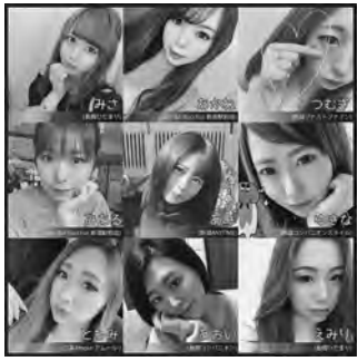
▶スマホでお気に入りの女の子を選んで、オンラインで会話しよう